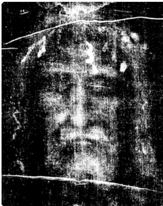
Лик Спасителя на фотографии Туринской Плащаницы

За всю историю своего существования, до захвата его еретиками-крестоносцами и исчезновения вместе с кораблем во время бури в Мраморном море, Нерукотворный Образ прославился неисчислимыми чудотворениями, которые и принесли ему всемирную славу.