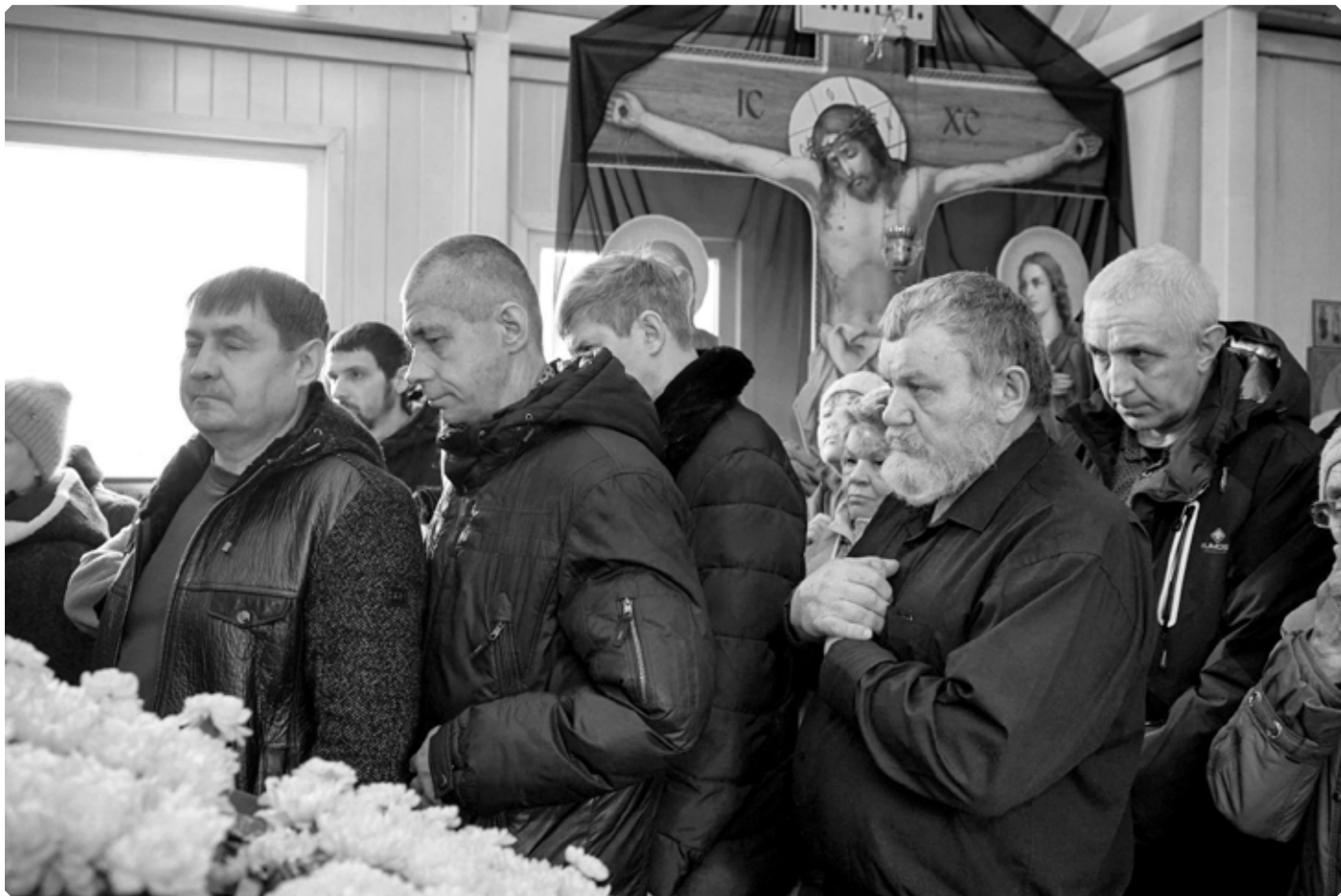
Прихожане храма Преображения Господня и жители города. Бийск. Крестопоклонная Неделя Великого поста. 15 марта 2026 г.

Кто хочет последовать за Христом, тот должен делать так, как делал Христос, а не так, как хочется самому последователю. Представьте себе, что какой-либо слепец нашел для себя благонадежного вожакого, который знает все пути, ведущие туда, куда слепцу следует идти. Не должен ли слепец неуклонно держаться своего доброго вожакого и не уклоняться от него ни направо, ни налево, чтобы не заблудиться, не преткнуться и не пасть? Так и последователь Христов должен делать то,