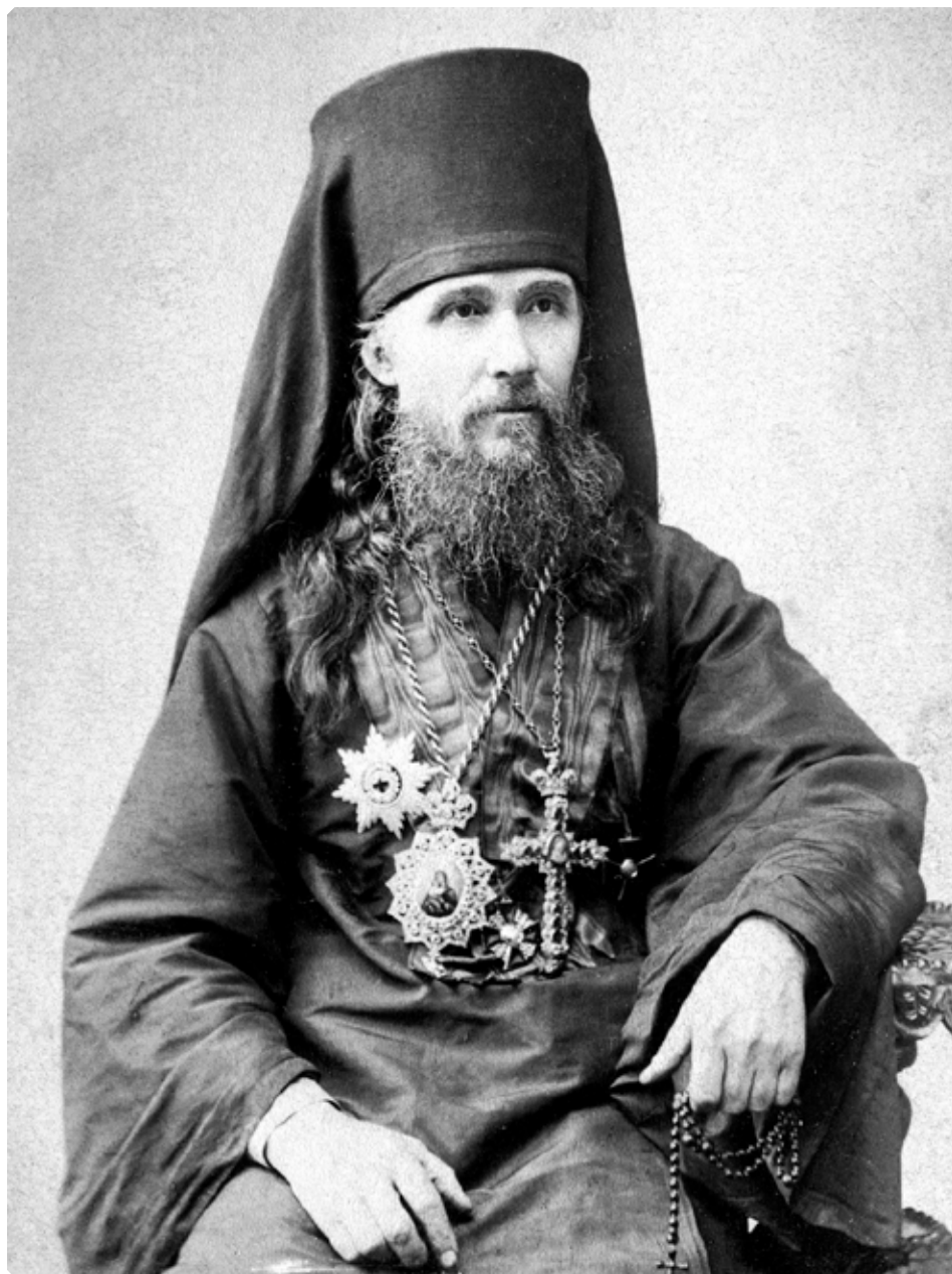
Преосвященнейший Макарий (Невский), епископ Бийский. 1890 г.

(Невского) рядом с архиерейским подворьем и открыта в 1885 году.