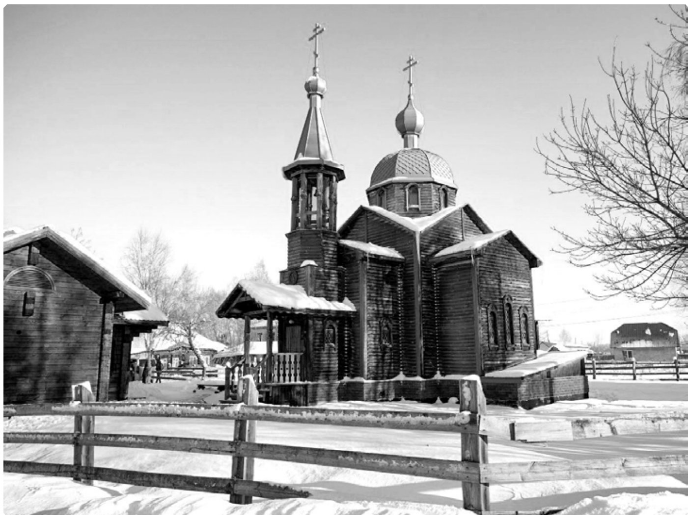
Храм святой мученицы Татианы. Село Новотырышкино. 28 декабря 2025 г.

В январском и февральском выпусках рубрики «Архиерейское служение» была опубликована статья «Благослови, Господи, начинающийся новый год!», тесно связанная с историей новотырышкинского православного прихода. В ней самым подробным образом был рассмотрен документ, хранящийся в Государственном архиве Томской области – «Ведомость о Свято-Троицкой церкви Бийского округа села Ново-Тырышкино за 1870 год».