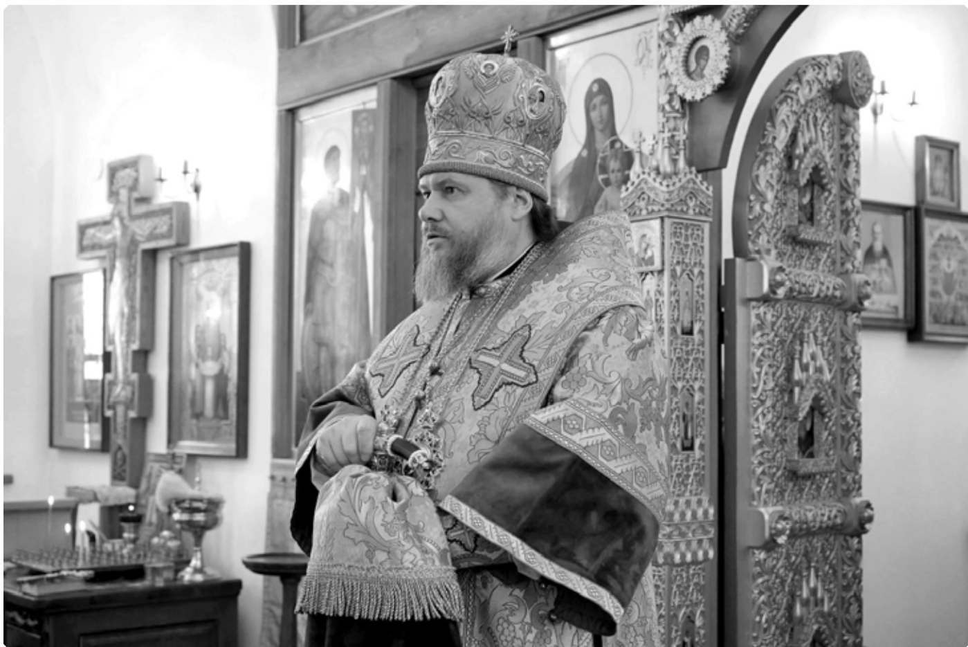
Преосвященный Серафим, епископ Бийский и Белокурихинский, в храме святой мученицы Татианы. Село Новотырышкино. 28 декабря 2025 г.

В графе «Священно-церковнослужители» располагается следующая информация о причте: