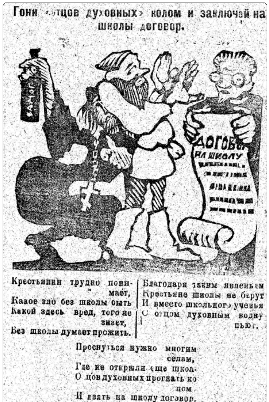
Агитационный рисунок «Гони отцов духовных колом...» – «Звезда Алтая». – 1923. – № 37. – С. 3.