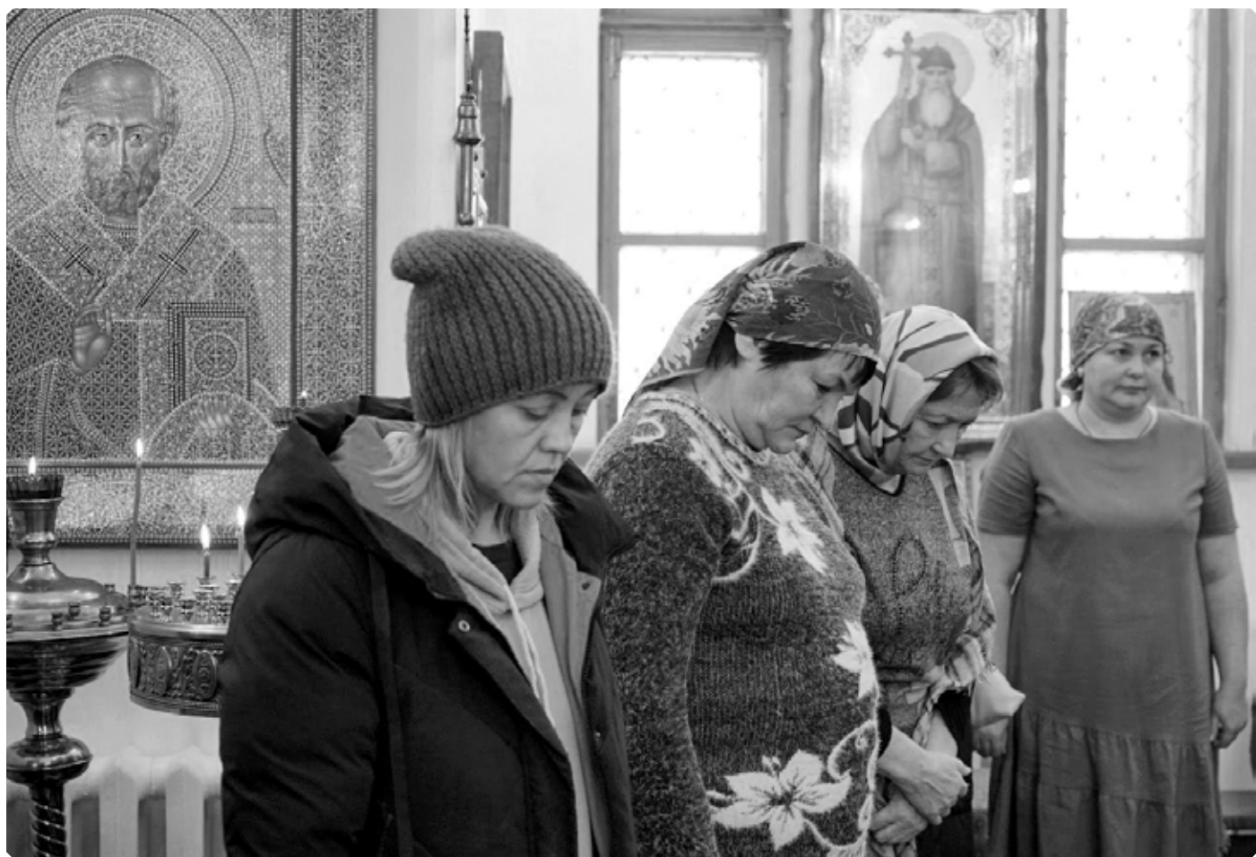
Прихожанки храма святой мученицы Татианы на архиерейском богослужении. Село Новотырышкино. 28 декабря 2025 г.

В деревне Ново-Белокурихе в 1892 году открыта школа грамоты; помещается в церковной сторожке; в минувшем учебном году занятий не было».